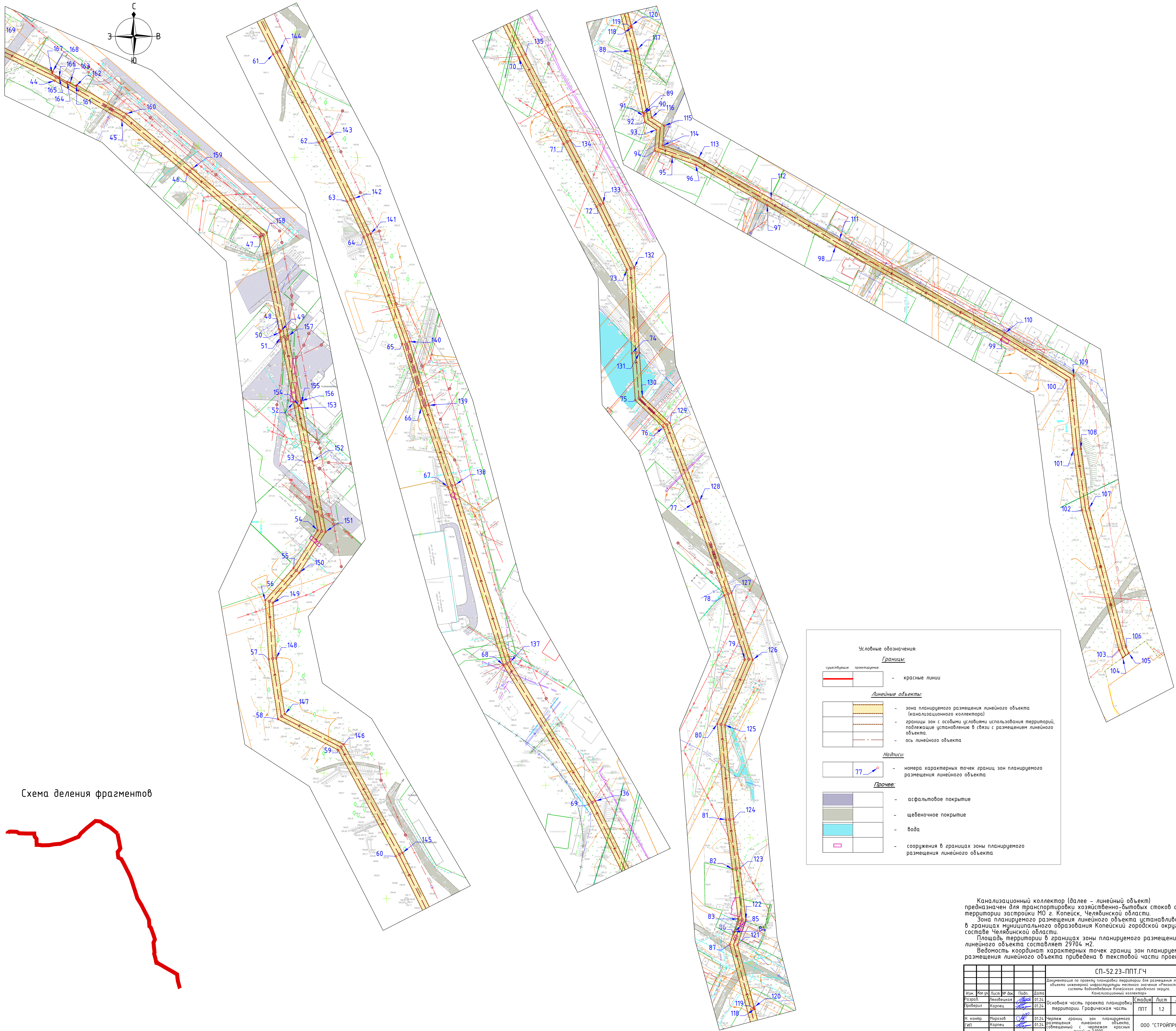
Схема деления фрагментов