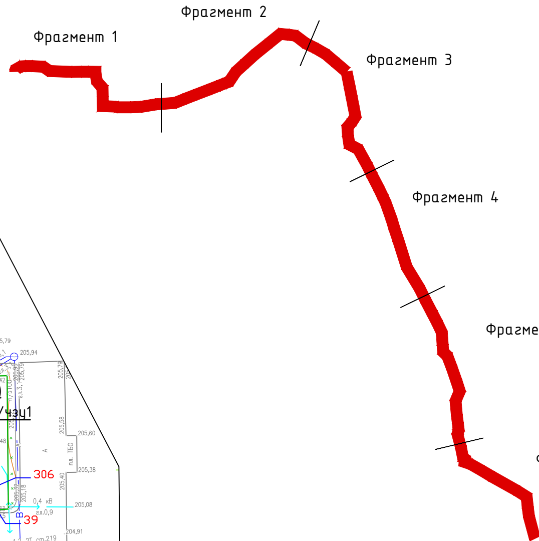
Перечень частей земельных участков в целях оформления сервитута под канализационный коллектор