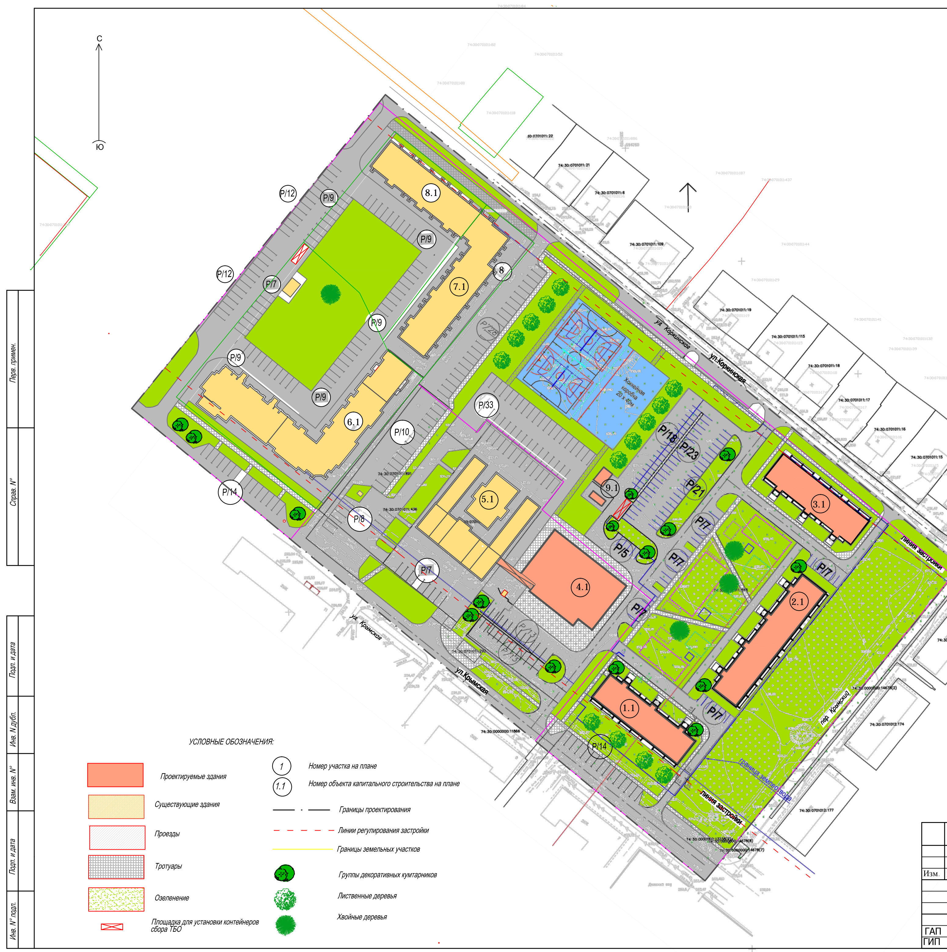
ВЕДОМОСТЬ ЗДАНИЙ И СООРУЖЕНИЙ