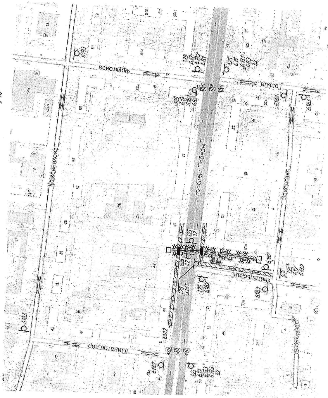
Схема организации движения транспорта и пешеходов на период производства земляных работ в районе жилого дома по пр. Победы 31а до МОУ "СОШ №21" по пр. Победы 42